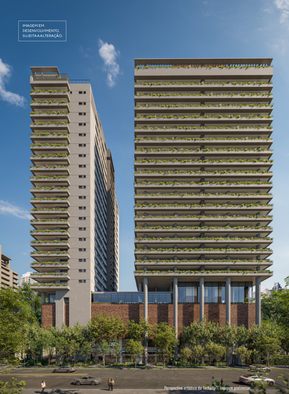
IMAGEM EM DESENVOLVIMENTO, SUJEITA A ALTERAÇÃO.

Perspectiva artística da fachada. Imagem preliminar.