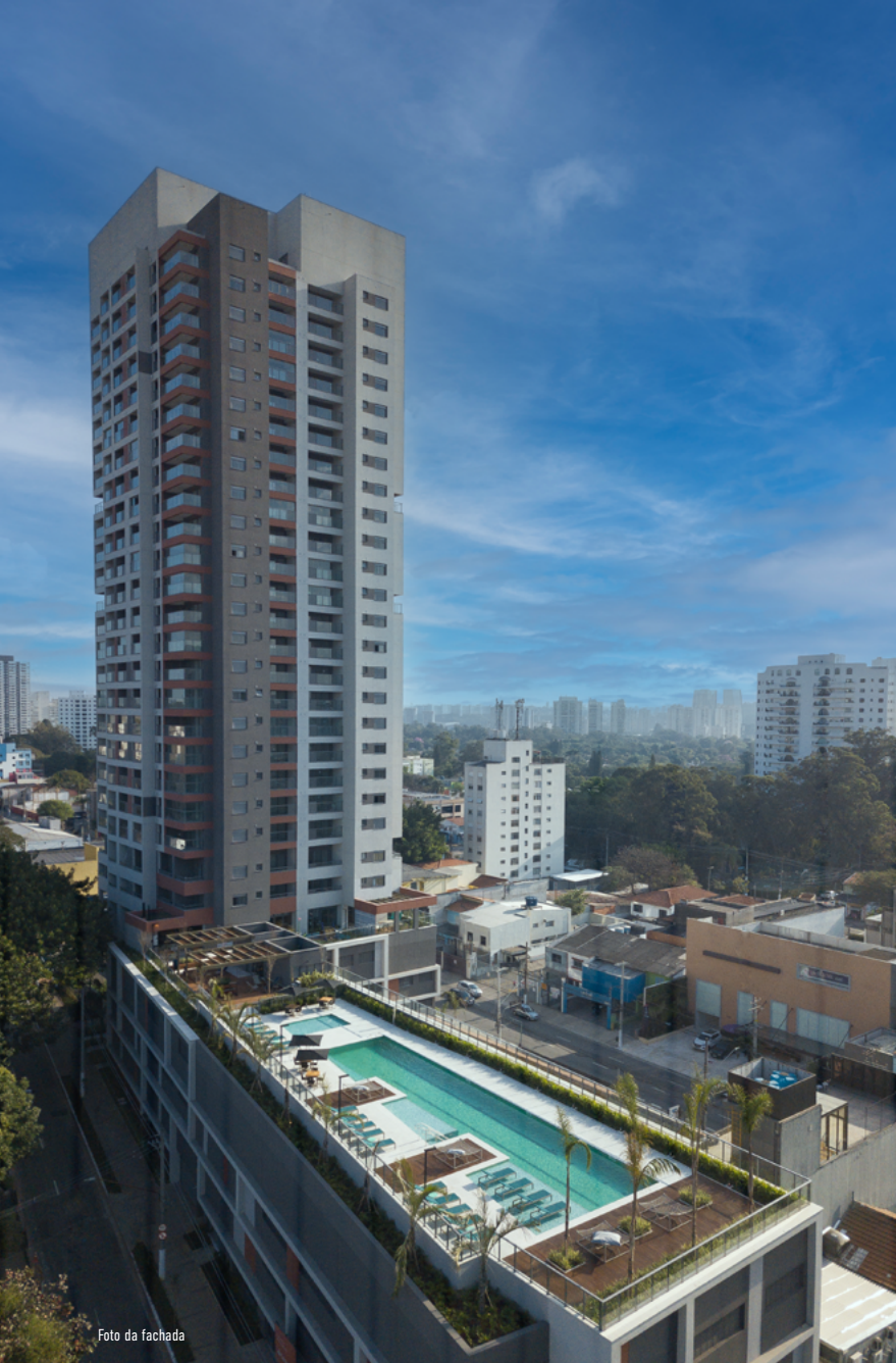
Foto da fachada